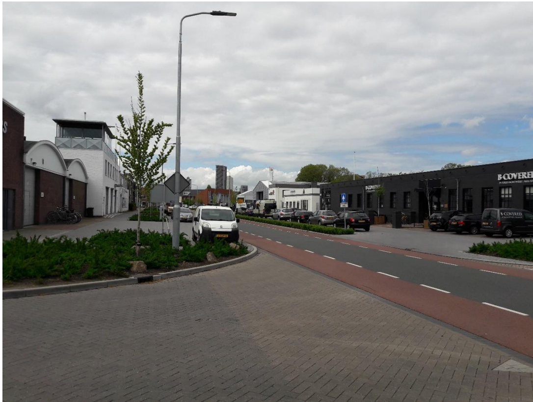
Slecht zicht vanuit de Gabriël Metsulaan naar links, richting Lucas Gasselstraat (door 'veroorzaker') vanwege geparkeerde auto.